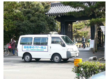
[巡回中の交通安全広報車両]