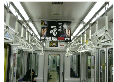
[飲酒運転根絶ポスターの掲出風景]